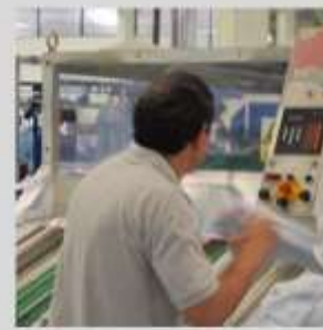
Diferentes imágenes del proceso productivo de lavado de SOEMCA.