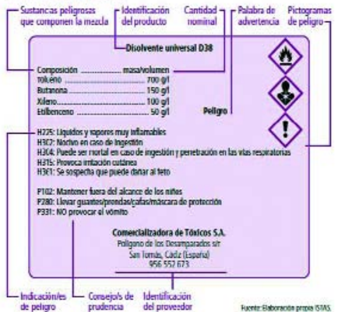
Gráfico 3. Ejemplo de etiqueta

6. Consejos de prudencia: Son recomendaciones para la adopción de medidas a tomar que reducen o previenen los efectos adversos causados por la exposición a un producto peligroso.