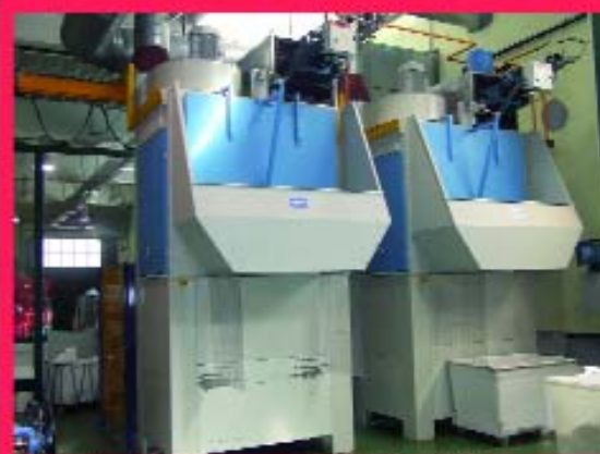
Túnel de lavado de ropa con capacidad para 800 kg/hora