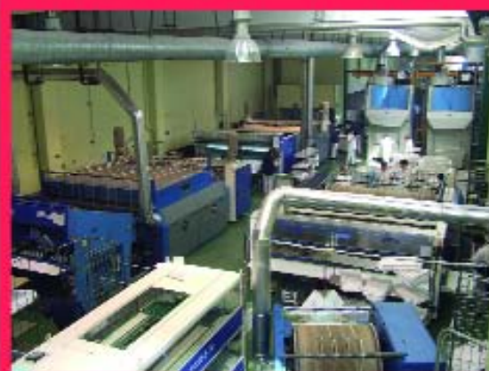
Capaces de atender a toda la hostelería de Cantabria