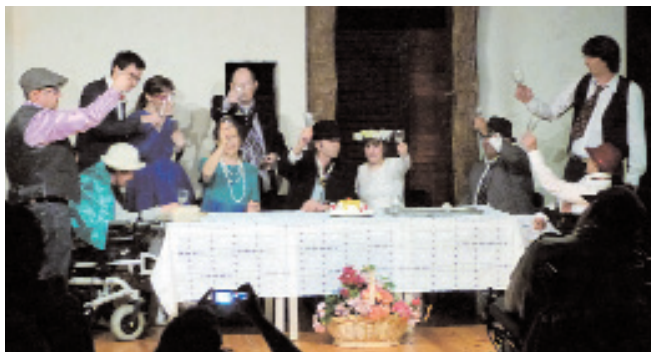
12 miembros de EAPN estrenaron en mayo la obra de teatro fruto del trabajo del curso de improvisación.

Esta actividad se ha podido llevar a cabo gracias a la colaboración de la Red Cántabra contra la Pobreza y la Exclusión Social –EAPN Cantabria– y el Centro de Formación e Investigación Escénica del Palacio de Festivales, que ha puesto a disposición del grupo una profesora y las instalaciones de la escuela de forma gratuita. EAPN-ES ha participado también en la organización de esta actividad, que cuenta con la financiación del Ministerio de Sanidad, Servicios Sociales e Igualdad a través de un programa IRPF de sensibilización a la inclusión y el voluntariado.