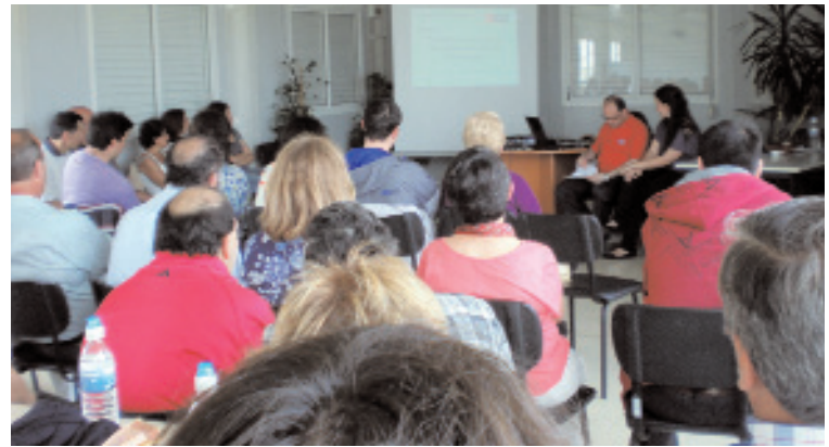
El seminario se celebró en el centro Entorno y asistieron 47 personas.