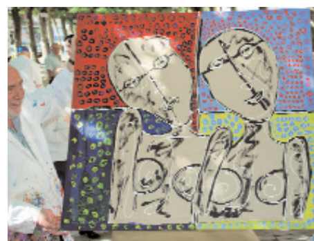
El arte se fue haciendo realidad poco a poco. La sucesión de imágenes muestra como fue posible realizar la obra.