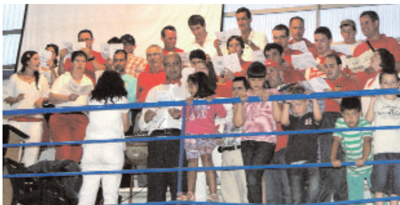
El coro de AMICA puso el punto cultural a la fiesta.

Destacó el 'Mercadillo Solidario', donde se vendieron objetos elaborados en los centros