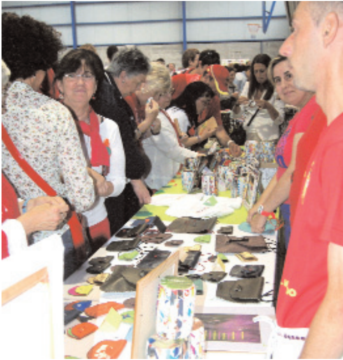
El mercadillo solidario recaudó un buen pellizco para ayudar a la crisis alimentaria en el Sahel.

de AMICA y postres elaborados y donados por socios y amigos. En total se recaudaron 1.737 euros, que se van a destinar a través de los programas de UNICEF, a ayudar a paliar la crisis alimentaria en El Sahel africano.