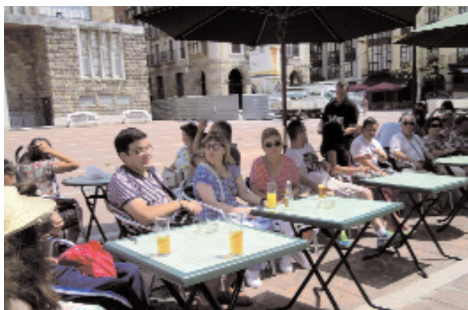
Antes de la comida de verano, tomamos el aperitivo en la Plaza Roja de Torrelavega.

Como todos los años, los centros aprovechamos el verano para juntarnos con las familias y, con ese motivo, Formación de Adultos del centro Horizon, celebró una comida el 27 de julio en un restaurante de Torrelavega a la que asistieron 63 personas entre alumnos, familiares y profesionales. También fueron antiguos alumnos, que nunca faltan a estas conmemoraciones. Primero tomamos el aperitivo en la Plaza Roja y, como siempre, fue un encuentro divertido que la mayoría quiere repetir pronto.