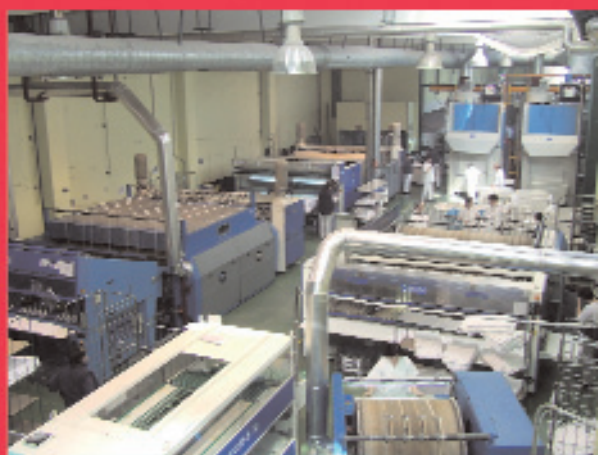
Capaces de atender a toda la hostelería de Cantabria