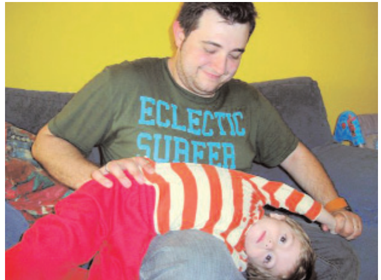
Fisioterapeuta especializado en Fibrosis Quística.

• Tratamiento: Se basa en tres pilares fundamentales: conseguir una nutrición adecuada, utilizar medicamentos que luchen contra la infección e inflamación respiratorias y realizar con regularidad la terapia física consistente en fisioterapia respiratoria, ejercicios de fortalecimiento de la musculatura del tórax para prevenir deformidades y la práctica de algún deporte.