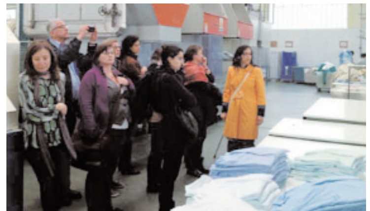
Participantes del proyecto europeo Grundtvig durante su visita a las instalaciones de AMICA.

El principal objetivo de Grundtvig es el intercambio de experiencias en métodos de empoderamiento a través del aprendizaje permanente en áreas metropolitanas.