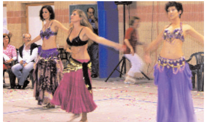
Bailes y danzas nos animaron a mover nuestros cuerpos.