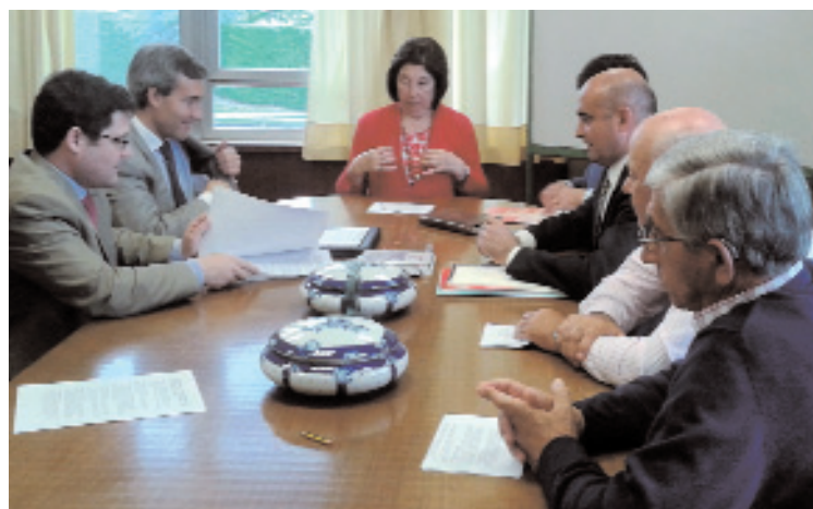
Encuentro de representantes de FLISA y AMICA en el centro de Formación y Empleo Marisma

Durante el encuentro, celebrado en el mes de julio en el centro Marisma en Maliaño, donde se encuentra la Lavandería Alba 3, se ha valorado la necesidad de seguir profundizando en la metodología de gestión de cada entidad y de esa forma poder estudiar fórmulas adecuadas para una colaboración más estable en un futuro cercano.