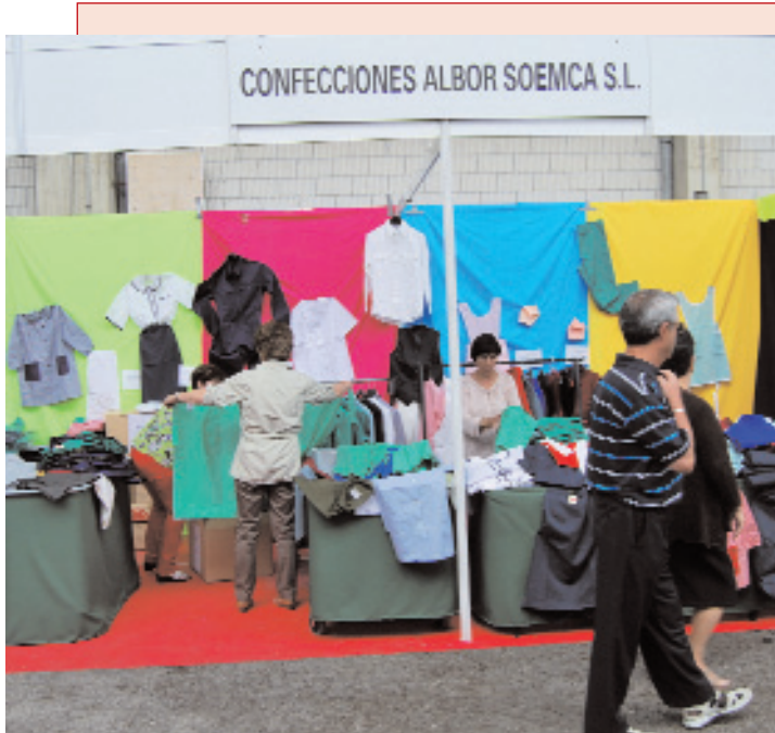
Confecciones Albor ofertó en la Feria del Stock los restos de producción descatalogados a bajo precio.