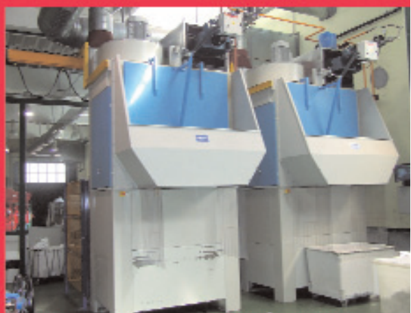
Túnel de lavado de ropa con capacidad para 800 kg/hora