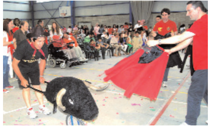
El encierro supuso el inicio de las actividades.