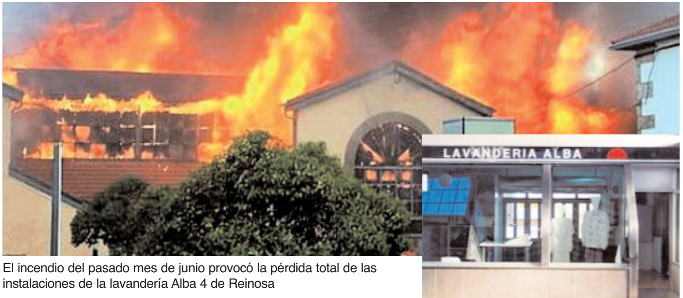
El incendio del pasado mes de junio provocó la pérdida total de las instalaciones de la lavandería Alba 4 de Reinoso