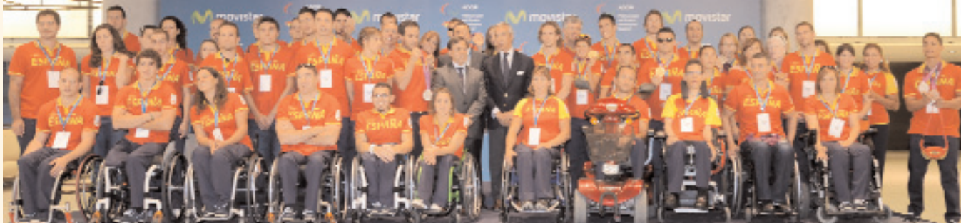
Equipo paraolímpico español

Por su interés, queremos compartir este artículo de Guillermo Fesser publicado en el diario digital Huffingtonpost.es con motivo de las Paraolimpiadas 2012. Como es muy extenso publicamos solo una parte y os animamos a leerle completo en el enlace: http://www.huffingtonpost.es/guillermo-fesser/londres-2012-unos-juegos-_b_1849376.html