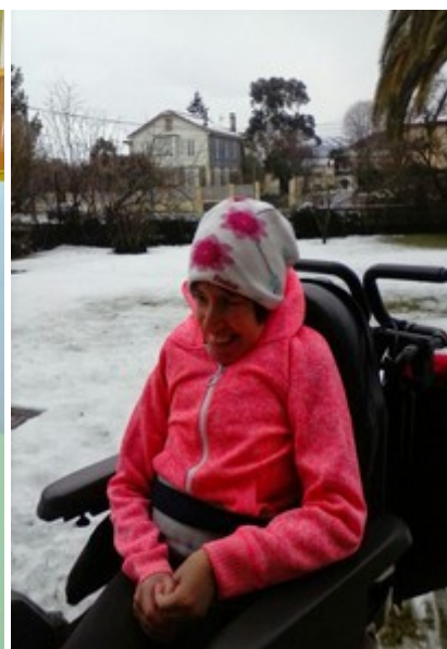
Hacía mucho tiempo que no veíamos nevar en Torrelavega