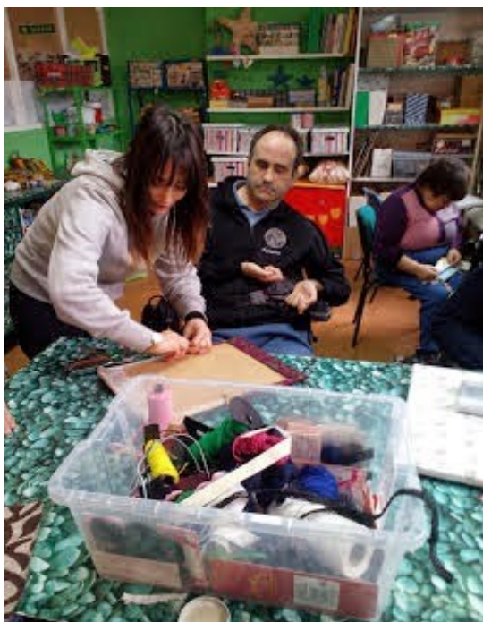
Hacemos unas corcheras decoradas para el mercadillo solidario