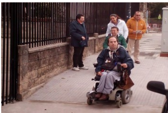
Fuimos a Corrales para comprobar las buenas prácticas en accesibilidad por parte del ayuntamiento