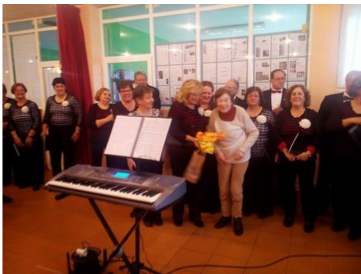
Disfrutamos la actuación del coro "Aires del Castro" de Hinojedo